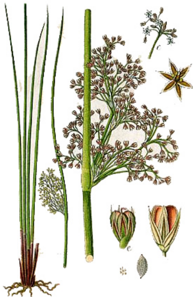
Lockerblütige Binse, Juncus effusus.

Significados básicos: Propósito, direção, cura